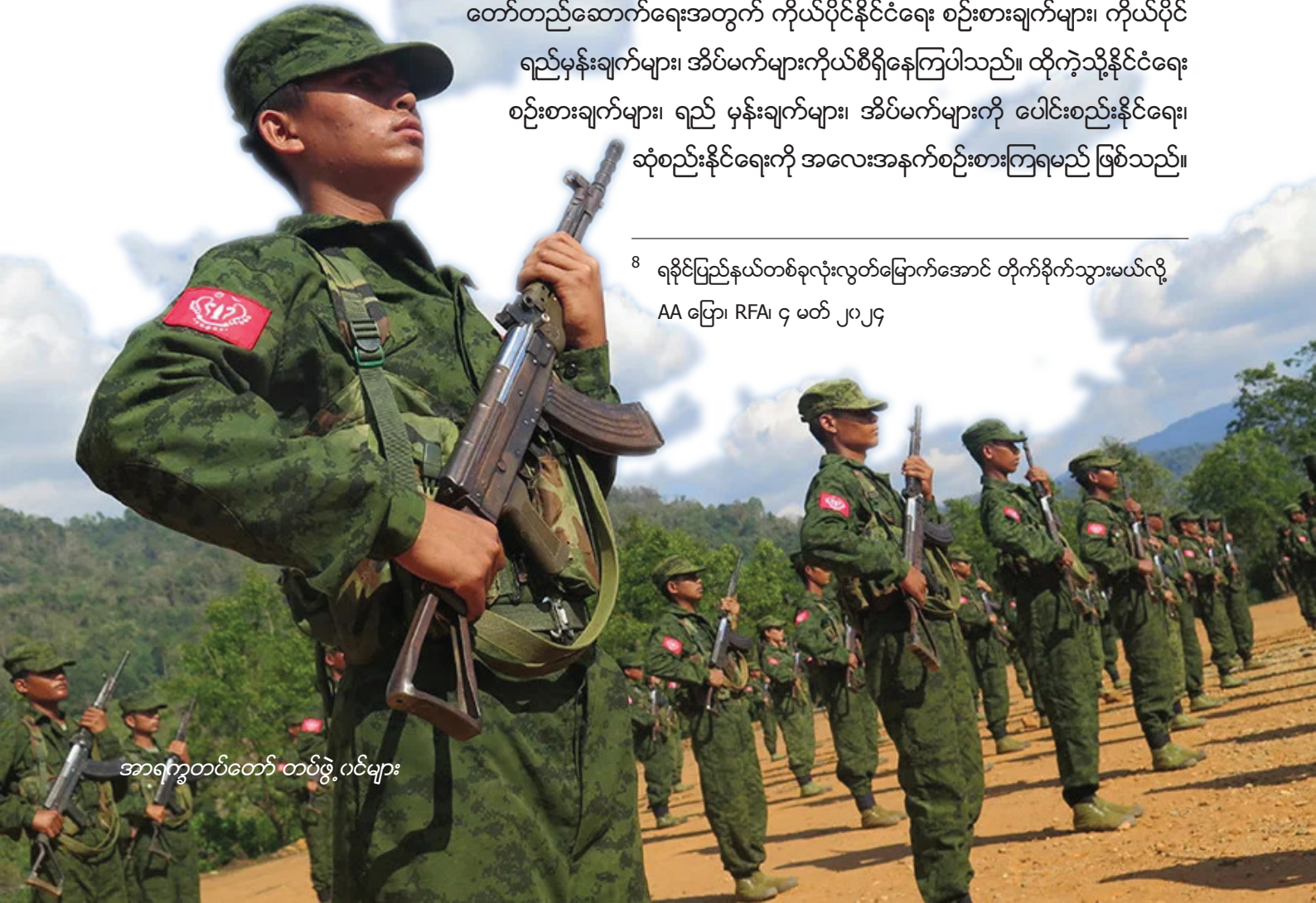
အာရက္ခတပ်တော် တပ်ဖွဲ့ဝင်များ