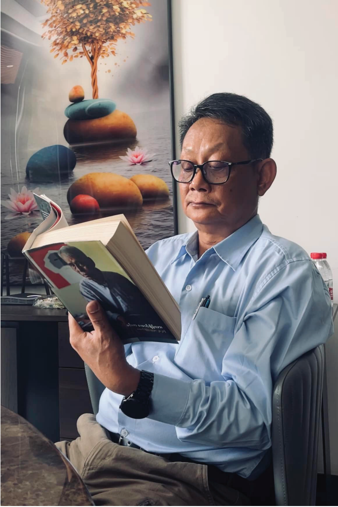
NUG ကာကွယ်ရေးဝန်ကြီး ဦးရည်မွန်

(၂) စစ်ရေးပူးပေါင်းဆောင်ရွက်မှုများမှတစ်ဆင့် နိုင်ငံရေးသဘောတူညီချက်များဆီသို့ ဦးတည်စေရန်